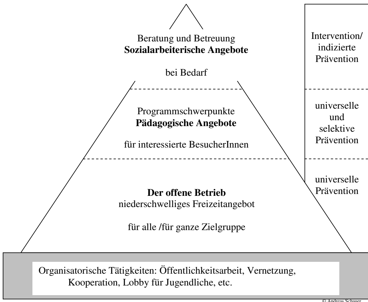
Abbildung 1: Arbeitsebenen professioneller Jugendzentren/-treffs

Dieses vom Autor selbst entwickelte Modell zeigt einen differenzierten „Querschnitt“ der Arbeit in professionellen Jugendzentren/-treffs. Es hat sich in den letzten Jahren zur Präsentation der Jugendarbeit von professionellen Jugendzentren/-treffs bewährt. Es ist leicht verständlich auf der einen Seite und zeigt den vielfältigen, umfassenden Charakter der Arbeit auf der anderen. Darüberhinaus lässt sich mit dem Modell die Professionalität der Arbeit im Jugendzentrum/-treff auf Basis fundierter, fachlicher Grundlagen sehr gut vermitteln. Auch zur Planung und Evaluierung des Angebots ist dieses Modell als theoretischer Hintergrund geeignet und wird als solches im Jugendzentrum Bagger, Waidhofen an der Ybbs, angewandt.