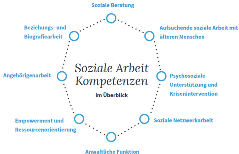
Abbildung 2: Überblick über sozialarbeiterische Kompetenzen (AG „Altern und Soziale Arbeit“ der OGSA 2017:14)

soziale Netzwerkarbeit, die anwaltliche Funktion sowie die psychosoziale Unterstützung und Krisenintervention eingegangen.