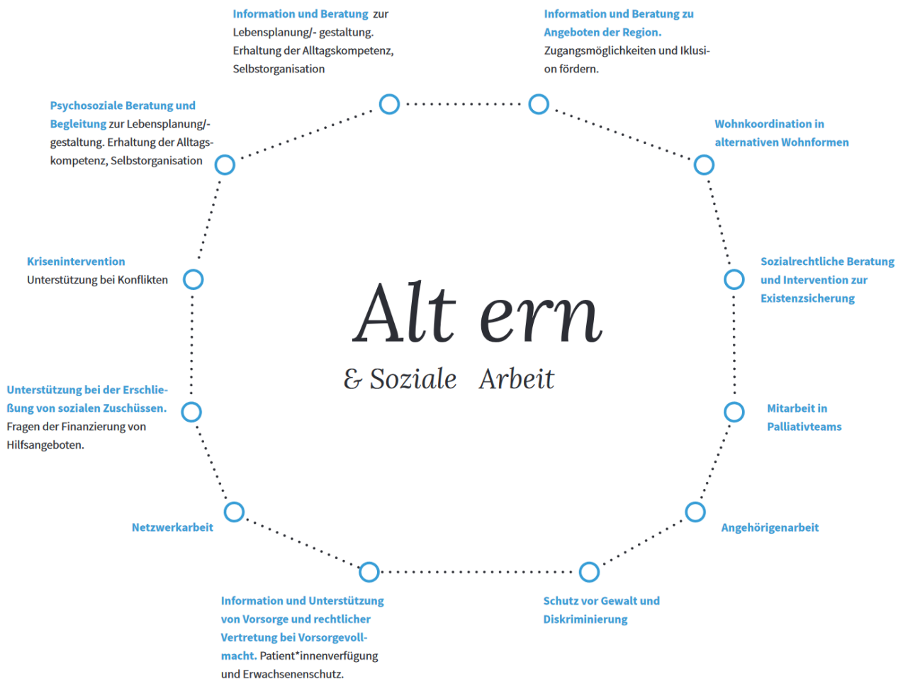
Abbildung 1: Übersicht Aufgabenbereich Soziale Arbeit mit älteren Menschen - AG „Altern und Soziale Arbeit“ der OGSA (2017)