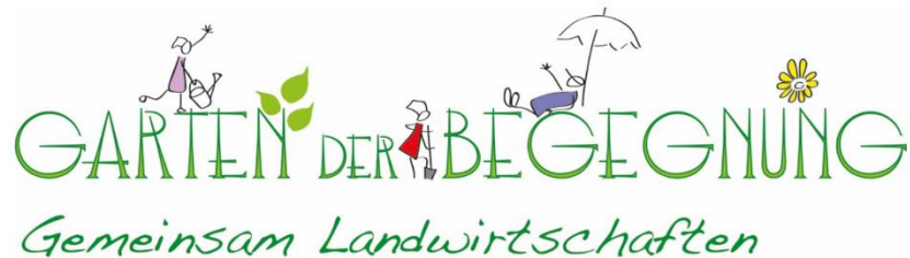
Abbildung 5: Homepage Garten der Begegnung

Im Zuge der Darstellungen zum Forschungszugang soll der „Garten der Begegnung“ in Traiskirchen hier kurz vorgestellt werden.